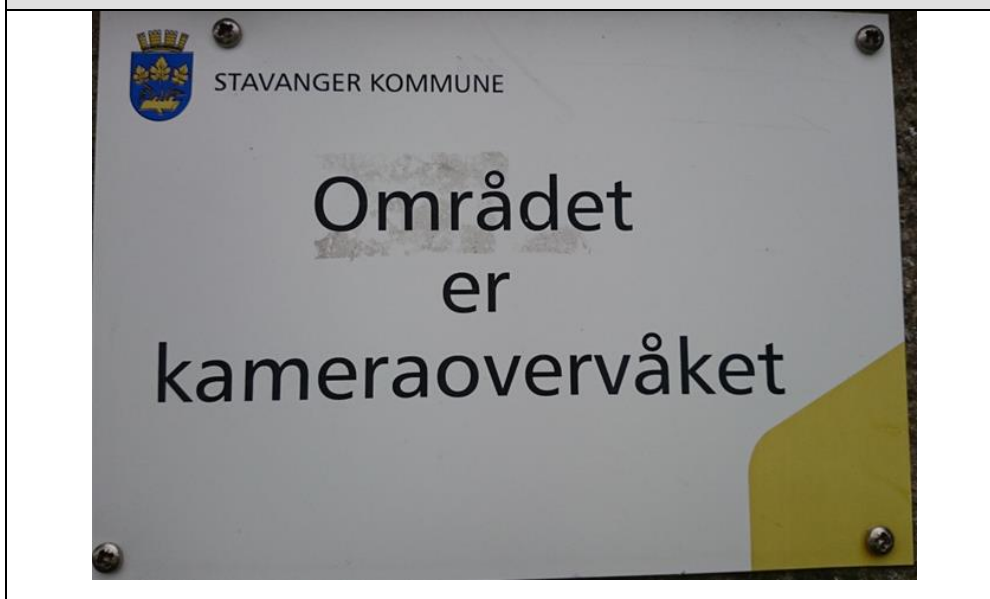
Bilde 1 – Varslingsskilt

Med de nye skiltene til Stavanger Eiendom, er det lagt til et kamera symbol som bør være gjenkjennelig for de fleste, informasjon om at området er kameraovervåket og hvem som er behandlingsansvarlig. Det kunne kanskje vært lagt til kontaktinformasjon til Drift og energi ved Stavanger Eiendom.