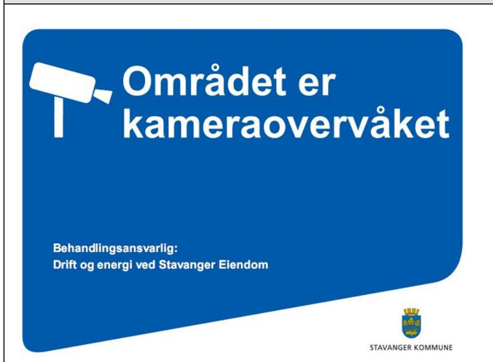
Bilde 2 – Nytt varslingskilt

De fleste rektorene og verneombudene vi snakket med visste ikke hvor mange kamera som fantes på skolene eller hvor de var plassert. Kun i barnehagen, et relativt lite bygg, og på en av skolene viste man stort sett hvor alle kameraene var plassert. På denne aktuelle skolen hadde man fått tilsendt en oversikt, den samme som vi har fått fra Stavanger Eiendom som viser plassering og kameravinkel, men de var ikke klar over at de nyere kuppelkameraene faktisk var kamera og ikke utelys.